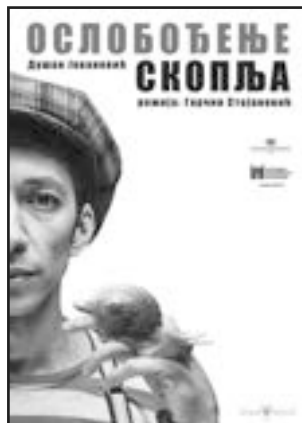
ОСЛОБОЂЕЊЕ СКОПЉА НАРОДНО ПОЗОРИШТЕ НИШ / НАРОДНО ПОЗОРИШТЕ ЛЕСКОВАЦ