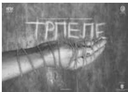
ТРПЕЛЕ КРАЉЕВАЧКО ПОЗОРИШТЕ / ШАБАЧКО ПОЗОРИШТЕ