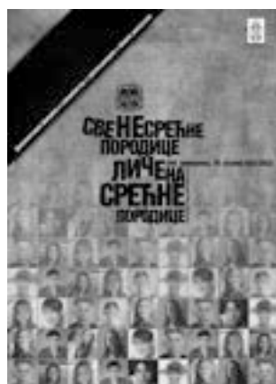
СВЕ НЕСРЕТНЕ ПОРОДИЦЕ ЛИЧЕ НА СРЕТНЕ ПОРОДИЦЕ НАРОДНО ПОЗОРИШТЕ ПИРОТ