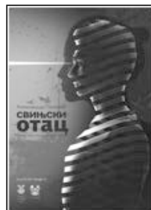
ПРЕДСТАВА У ЧАСТ НАГРАЂЕНИХ СВИЊСКИ ОТАЦ НАРОДНО ПОЗОРИШТЕ УЖИЦЕ