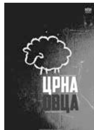
ЦРНА ОВЦА КРАЉЕВАЧКО ПОЗОРИШТЕ