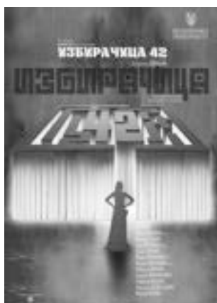
ИЗБИРАЧИЦА 42 КРУШЕВАЧКО ПОЗОРИШТЕ