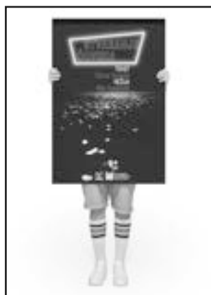
СТВАРАЊЕ ЧОВЕКА НАРОДНО ПОЗОРИШТЕ ЛЕСКОВАЦ